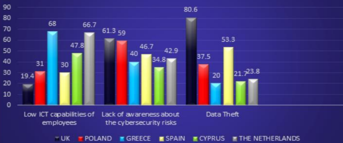
The biggest security challenges (%)