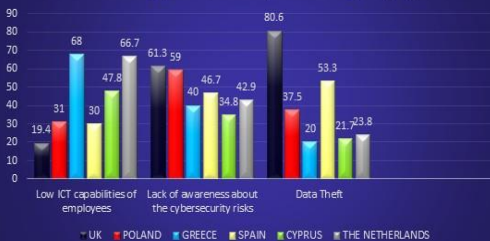
The biggest security challenges (%)